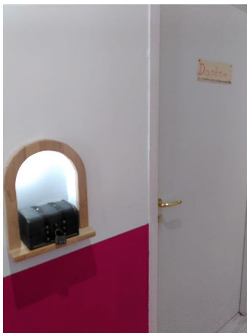
Accès aux chambres et coffres à clé

Tout objet manquant à l'inventaire doit être signalé à votre arrivée, de sorte que vous ne puissiez pas être tenus pour responsable des manquants.