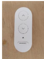
Commande des stores (Julian et Daphne)

En période chaude, ouverture des fenêtres la nuit et utilisation des stores et rideaux fenêtres fermées aux heures ensoleillées.