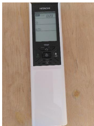
Commande du chauffage / climatisation (chambres)

Chaque chambre est équipée d'une télécommande pour la climatisation réversible reliée à un appareil commun. Pour assurer le bon fonctionnement de l'appareil ainsi que pour une consommation énergétique responsable, il n'est pas autorisé d'utiliser le mode climatisation lorsque la température de la chambre est inférieure à 20°, et il n'est pas autorisé d'utiliser le mode chauffage lorsque la température de la chambre est supérieure à 20°. La sollicitation de l'appareil central simultané en mode chaud et en mode froid est susceptible de gravement endommager l'équipement, merci de veiller à éviter cette configuration.