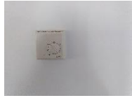
Commande du chauffage (salle commune)

Les portes et fenêtres de la chambre doivent être fermées durant l'utilisation de la climatisation réversible.